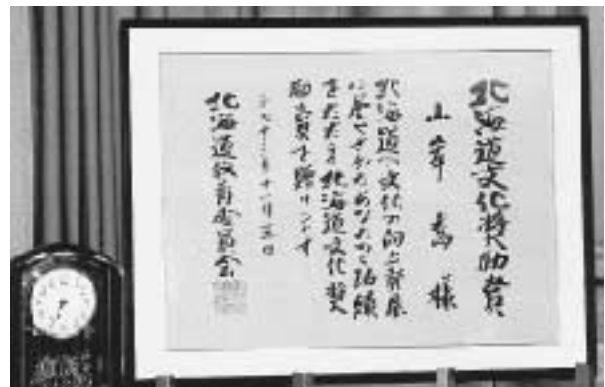
北海道文化奨励賞 (日展審査委員・中野北溟書)