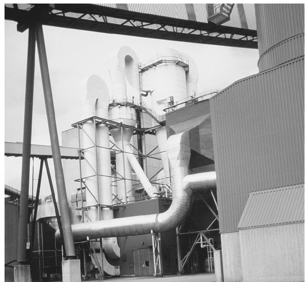
写真1 サンビックⅡの外観

南スウェーデンの森林バイオマス利用のレクチャーを受けたが、講義の前に、教授がコーヒータイムをとったり、講義の途中で我が子をあやしたりするという話を聞き、その自由な雰囲気うらやましく思われた。ちなみに、12・13日の宿泊先は、SAS ロイヤルコーナー。