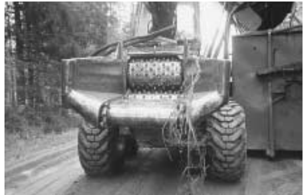
写真3 木質燃料の伐採・チップ化作業

燃焼の試験、流動床での燃焼試験などが印象に残った。家庭用のペレットストーブとその燃料の展示も。その後、ユバンスキュラ近郊のマルチアジョイント・ベンチャーという名の木材製材工場と自治体の熱供給事業が一体になった施設を見学した（写真4）。その後、ムーミン博物館のあるタンペレ市を經由して、鉄道ヘルシンキへ戻った。