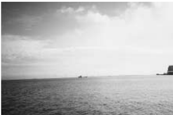
写真2 デンマークの洋上風力発電

16日は、コペンハーゲン空港よりルフトハンザ2866便にて空路フィンランドの首都ヘルシンキへ（2時間40分）。その後、目的地ユバンスキュラへ国内線にて空路50分の旅。着陸寸前の眼下には見紛ごうことなき「森と湖の国」。湖は大小あわせて70万あるそう。そして、陸路を行くとそこは北海道と似た風景。