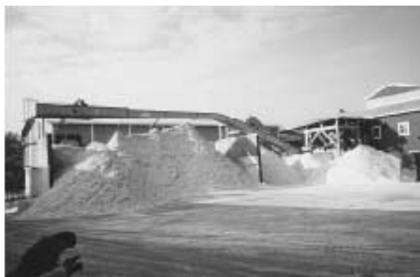
写真4 ムルティアジョイント・ベンチャーの外観

オホーツク圏でも、来年度4月開設をめざして木質系バイオマス研究会・オホーツクの準備会が発足して、メーリングリストを設置して情報交換の傍ら、参加者を募集している。